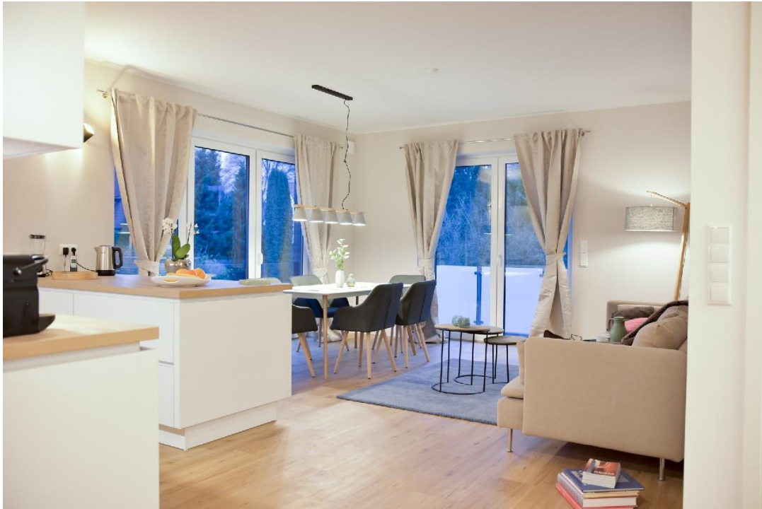
Wohnen - Essen - Kochen